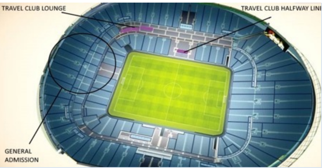
Vue depuis la catégorie General Admission :