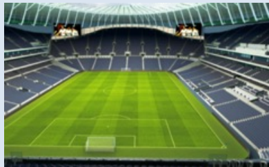
Vue depuis la Travel Club Lounge Half Way Line :