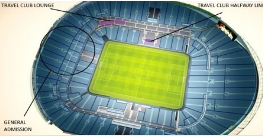
Vue depuis la catégorie General Admission :